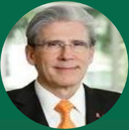
Dr. Julio Frenk Mora