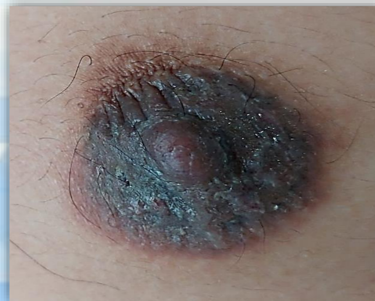
Figura 1. Lesión papulovesicular en CAP mama derecha con áreas de descamación.

Masculino de 28 años de edad, sin antecedentes heredofamiliares, personales patológicos y no patológicos de importancia para la patología en cuestión, hábitos higiénico-dietéticos regulares y niega antecedentes de atopia. El cual acude a consulta de clínica de mama por presentar desde hace 6 meses una mancha oscura en complejo areola pezón de mama derecha, observándose dermatosis papulovesicular, con engrosamiento cutáneo, placas hiperpigmentadas en areola, pequeñas áreas de descamación y exudado amarillento, viscoso (fig. 1), con prurito, por lo que se inicia tratamiento tópico sin presentar mejoría clínica. Se realiza toma de biopsia de lesión y se envía a patología, reportándose "estrato córneo en red de canasta, epidermis con patrón psoriasiforme, caracterizada por acantosis regular, espongirosis, vesícula espongiótica intraepidérmica e hiperpigmentación de la capa basal y dermis reticular superficial con infiltrado inflamatorio por linfocitos" (fig. 2), estableciendo como diagnóstico dermatitis espongiótica y psoriasiforme por linfocitos, determinando cambios consistentes con eccema subagudo de pezón, por lo que posteriormente es referido a la unidad de dermatología para su manejo.